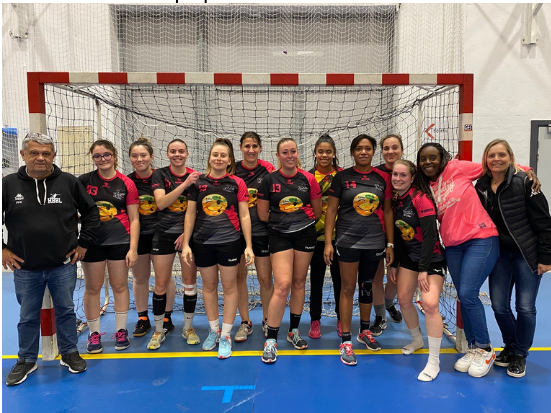
Equipe SENIORES Féminines