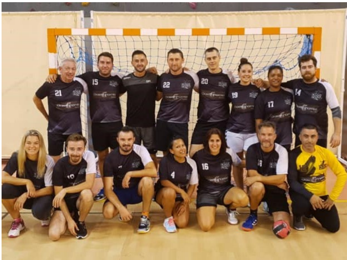
Equipe SENIORS Loisirs