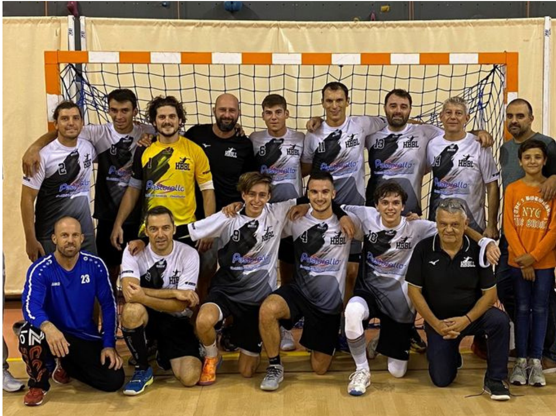
Equipe SENIORS Masculins