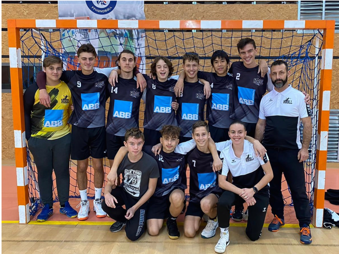
Equipe U17 Masculins